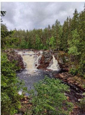
Wasserfall Ekshärad Socken