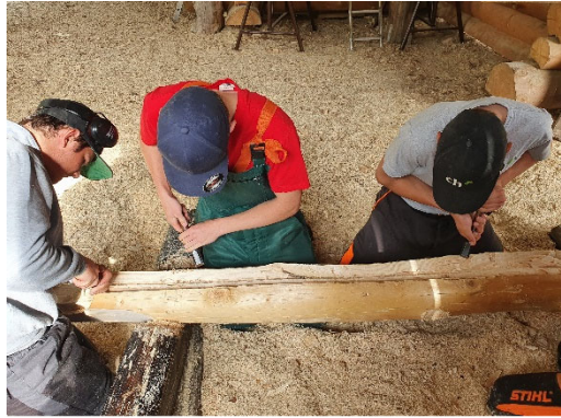
Arbeiten mit Stechbeitel