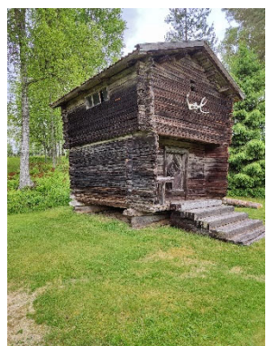
Holzhaus in Ekshärad Socken