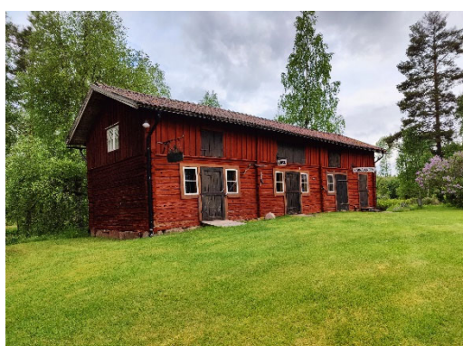
Holzhaus in Ekshärad Socken